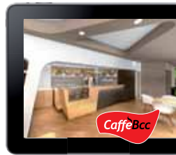
BAR / LUNCH BREAK